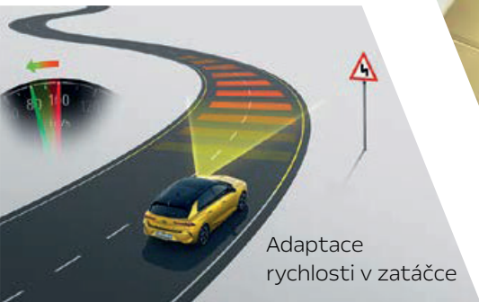
Adaptace rychlosti v zatáčce