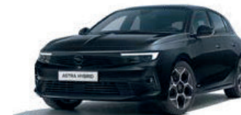
Černá Karbon Black