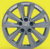
16" stříbrné ráfky z lehkých slitin Phantom