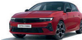
Červená Kardio Red