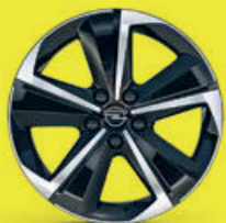
17" broušené ráfky z lehkých slitin Admiral