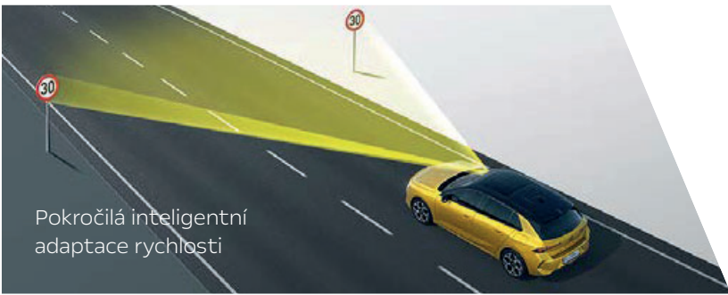
Pokročilá inteligentní adaptace rychlosti