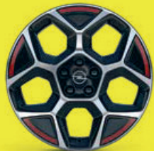
18" broušené ráfky z lehkých slitin Pentagon s červenými akcenty