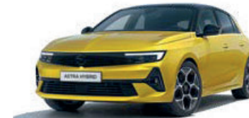
Žlutá Kult Yellow