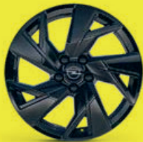
17" černé ráfky z lehkých slitin Kadett