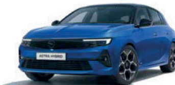
Modrá Kobalt Blue