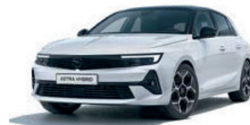
Bílá Arktis White