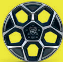
18" broušené ráfky z lehkých slitin Pentagon