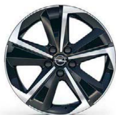
ZHYD/Mi19 (pro GS/Ultimate)