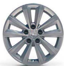
MI19 (pro Edition)